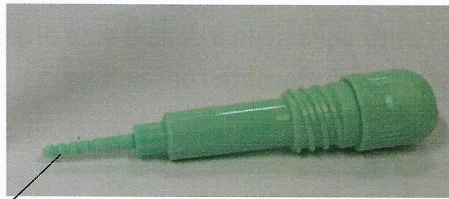
Bastoncino per la raccolta